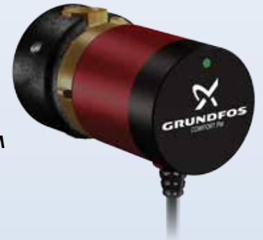
COMFORT B PM BASIC