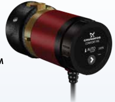
COMFORT BA PM AUTOADAPT