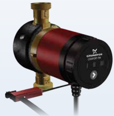
COMFORT BXS PM 3 FOKOZATÚ